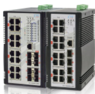
工業級供電網管型千兆交換機 IGS-1608SM-16PH & IGS-1604XSM-16PH