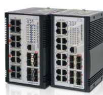
工業級供電網管型百兆交換機 IFS-1608GSM-16PH & IFS-1608GSM-8PH