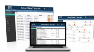
SmartView™ WEB EMS網管軟體 Element Management System

• The specification and pictures are subject to change without notice.