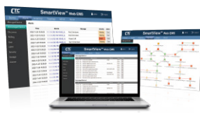
SmartView™ WEB EMS網管軟體 Element Management System

· The specification and pictures are subject to change without notice.