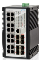
工業級網管型千兆PoE交換機 IGS-1608SM-8PH